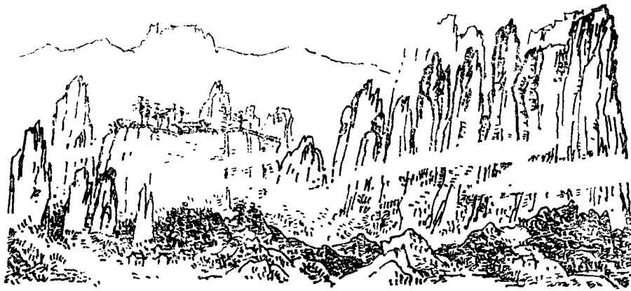
图 1 仙华峰林景观