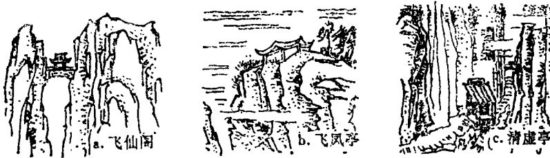
图4 仙华峰林的风景建筑

清虚洞,位于数峰围拥成的奥区。但原先岩洞较浅,规划于洞口建清虚亭,使古洞变得幽深(图4 c)。