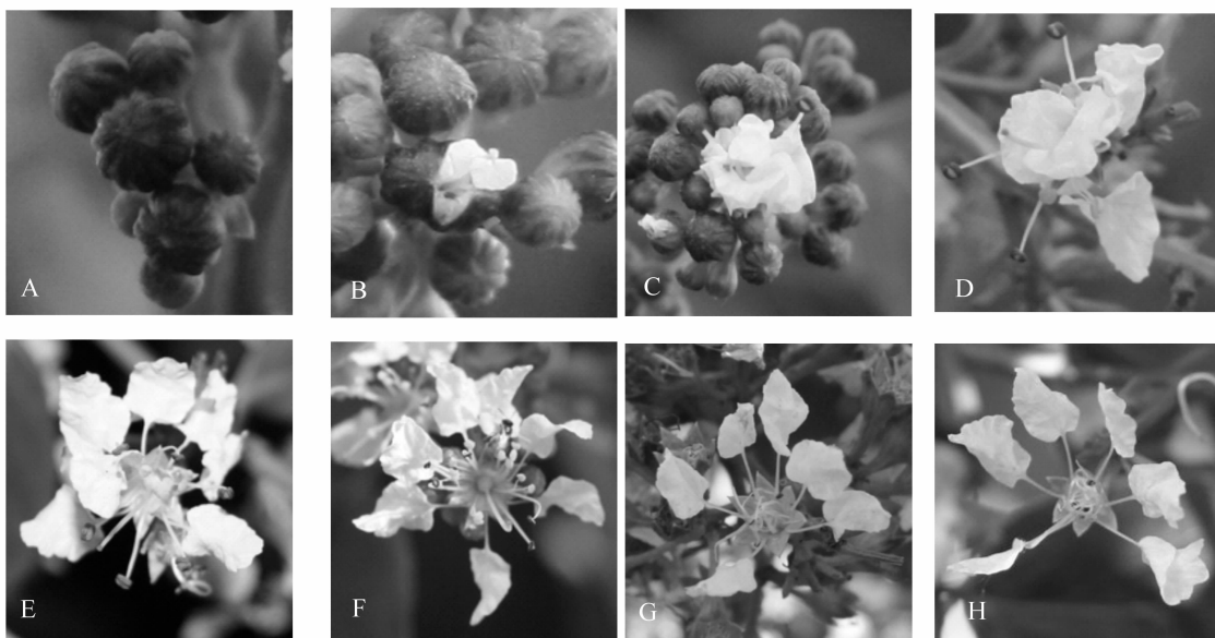
A: 3:00, 花苞尚未开裂; B: 3:30, 花萼开裂, 花瓣露出; C: 4:00, 花瓣部分伸出花萼, 长雄蕊伸出; D: 4:30, 花萼完全开裂, 长雄蕊全部伸出, 短雄蕊露出尚未展开; E: 5:00, 花瓣基本全部打开, 短雄蕊还未伸展; F: 6:00, 花瓣完全打开, 长短雄蕊均完全展开; G: 花后24 h, 雄蕊弯曲, 花瓣卷曲, 瓣爪伸直; H: 花后48 h, 雄蕊卷曲成团, 瓣爪完全伸直, 花朵平展。