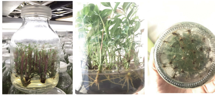
A. 不定芽诱导和增殖 B. 生根培养(侧面) C. 生根培养(底部)