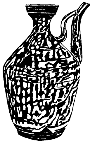
图2 中国民间陶油壶

民间艺术的美不仅仅体现在相互的简约美上，还体现在它的实用功能性以外，美的整体统一感上。如在南北乡村中常见的民陶“油壶”（图2）“油灯”，它们在大小尺度造型上有所不一，但造型整体圆浑丰满，在拉坯制作过程中，留下了一圈圈的手工弦弧纹，