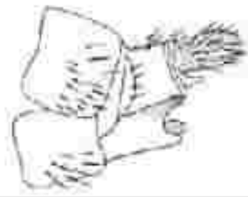
图 2 斯氏格菌蚊雌外生殖器侧视