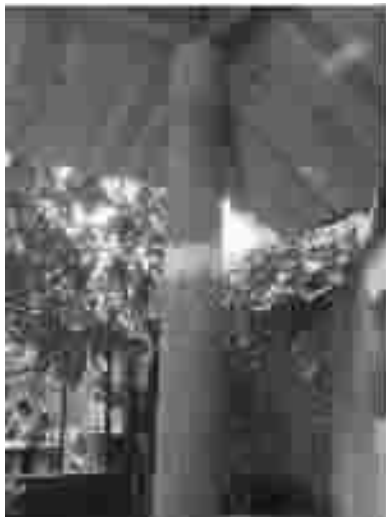
图5 水泥管制作的廊柱

庭院园路选用以粉煤灰、石子、水泥制成的新型混凝土砖铺设,强度高、表面粗糙防滑;用当今农村淘汰的旧小青瓦作院门盖瓦,砌筑花格窗;用废弃的旧黏土砖筑围墙;用旧木板竹条作篱笆栅栏;用废弃的洗脸盆盆栽花木;用废弃的电线杆作廊柱,既经济实惠,朴素且充满智慧。