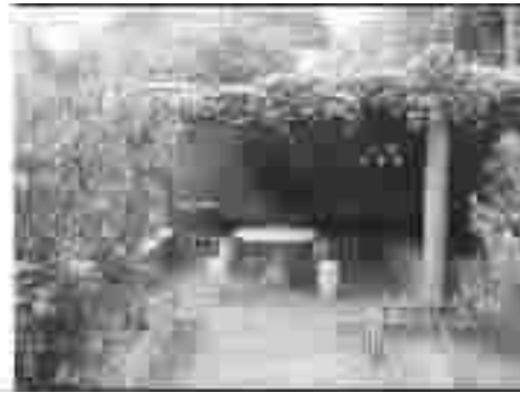
图4 改造后庭院中的荫棚