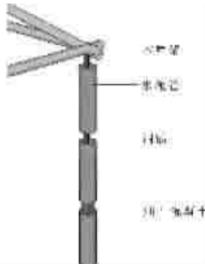
图6 廊柱制作示意图