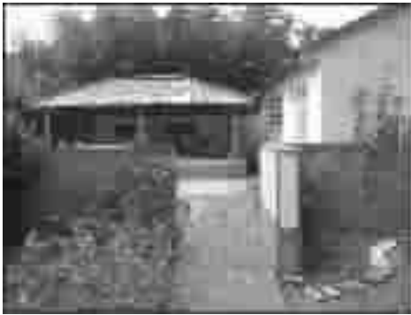
图3 改造后庭院中的亭廊

围墙上的花格窗,将院内的静谧与院外秀美的乡村景色相互借连,增加了空间的序列层次,并引进了院外田野徐徐清风凉意。另外,庭院中用矮照壁墙(高1 m)及地面铺装进行不同功能区块的分隔,整个庭院空间通过分隔与围合形成3个区域。东庭院相对狭小,用作相对隔离的杂物堆放处;西庭院中的接待餐厅与亭廊用于餐饮休闲;前庭院布置洗刷台和庭院小车位,并留有用竹篱笆分隔的小菜园,空间结构丰富有序,层次分明清晰。图3和图4分别为改造后庭院中的亭廊和荫棚。