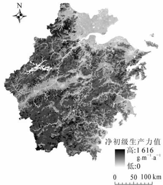
图1 2006年浙江省净初级生产力空间分布

3.2.1 各地市土地利用及净初级生产力贡献率分析 ①以11个地市净初级生产力均值为统计单位,使用欧氏距离-组间连接法进行聚类分析,将其分为5类。第1类为丽水市( 790.68 \text{ g}\cdot\text{m}^{-2}\cdot\text{a}^{-1} ),第2类包括杭州市、温州市、衢州市和湖州市等地(平均值为 663.35 \text{ g}\cdot\text{m}^{-2}\cdot\text{a}^{-1} ),第3类包括金华市、台州市、绍兴市和宁波市等地(平均值为 564.75 \text{ g}\cdot\text{m}^{-2}\cdot\text{a}^{-1} ),第4类为舟山市( 353.78 \text{ g}\cdot\text{m}^{-2}\cdot\text{a}^{-1} ),第5类为嘉兴市( 279.53 \text{ g}\cdot\text{m}^{-2}\cdot\text{a}^{-1} )。②以11个地市净初级生产力年总量为统计单位,使用欧氏距离-组间连接法进行聚类分析,将其分为5类。第1类为丽水市( 1\,336.05 \text{ 万 t}\cdot\text{a}^{-1} ),第2类为杭州市( 1\,094.38 \text{ 万 t}\cdot\text{a}^{-1} ),第3类包括金华市、温州市和衢州市等地(平均值为 683.45 \text{ 万 t}\cdot\text{a}^{-1} ),第4类包括台州市、宁波市、绍兴市和湖州市等地(平均值为 453.38 \text{ 万 t}\cdot\text{a}^{-1} ),第5类包括嘉兴市和舟山市等地(平均值为 78.47 \text{ 万 t}\cdot\text{a}^{-1} )。