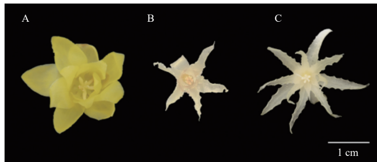
A. 蜡梅 C. praecox ; B. 柳叶蜡梅 C. salicifolius ; C. 山蜡梅 C. nitens

使用 SPME 装置收集挥发物。将新鲜盛开的花密封在顶空萃取瓶中, 并在鉴定挥发物前平衡 30