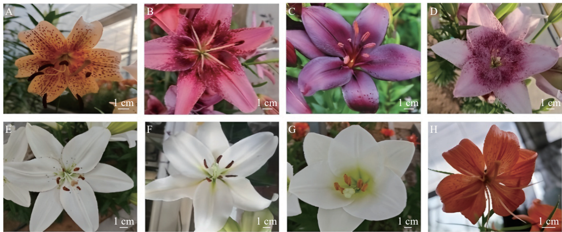
A. ‘虎宝宝’；B. ‘紫梦’；C. ‘黑色魅力’；D. ‘甜糖’；E. ‘眼线’；F. ‘小玩意’；G. ‘守望’；H. 兰州百合。