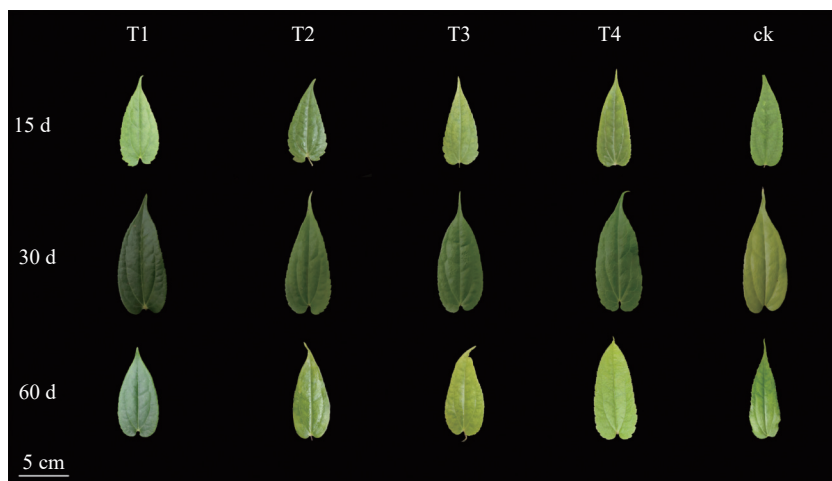
图 1 遮光对单叶铁线莲叶片形态变化的影响

遮光处理 30 d 后单叶铁线莲叶片颜色均比对照颜色深，其中 T1 为浓绿色；处理 60 d 后，T3、T4 处理组叶片发黄，对照叶片边缘及叶尖出现明显的皱缩和焦枯现象 (图 1)。表明遮光处理有利于叶片生长，高光强叠加高温会降低叶绿素的合成甚至使叶片受到损害。